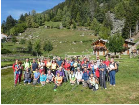
Lagunc 1.348 m

Le gite dei Seniores sono riservate a escursionisti soci Cai aventi esperienza di montagna adeguata alle caratteristiche e difficoltà del percorso, dotati di idoneo equipaggiamento e in buone condizioni di salute.